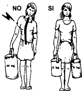
BILANCIARE SEMPRE I CARICHI