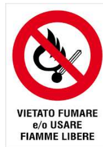
VIETATO FUMARE e/o USARE FIAMME LIBERE

L'incendio è la combustione (reazione chimica di un combustibile con un comburente in presenza di innesco) sufficientemente rapida e non controllata che può svilupparsi senza limitazioni nello spazio e nel tempo. Il rischio di incendio è sempre presente in qualsiasi attività lavorativa.