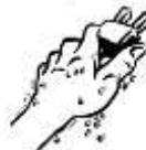
NO MANI BAGNATE