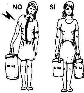
BILANCIARE SEMPRE I CARICHI