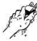
NO MANI BAGNATE