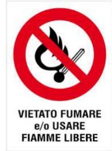
VIETATO FUMARE e/o USARE FIAMME LIBERE

L'incendio è la combustione (reazione chimica di un combustibile con un comburente in presenza di innesco) sufficientemente rapida e non controllata che può svilupparsi senza limitazioni nello spazio e nel tempo. Il rischio di incendio è sempre presente in qualsiasi attività lavorativa.