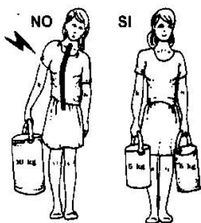
BILANCIARE SEMPRE I CARICHI