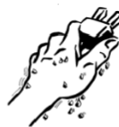
NO MANI BAGNATE