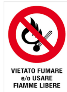
VIETATO FUMARE e/o USARE FIAMME LIBERE

L'incendio è la combustione (reazione chimica di un combustibile con un comburente in presenza di innesco) sufficientemente rapida e non controllata che può svilupparsi senza limitazioni nello spazio e nel tempo. Il rischio di incendio è sempre presente in qualsiasi attività lavorativa.